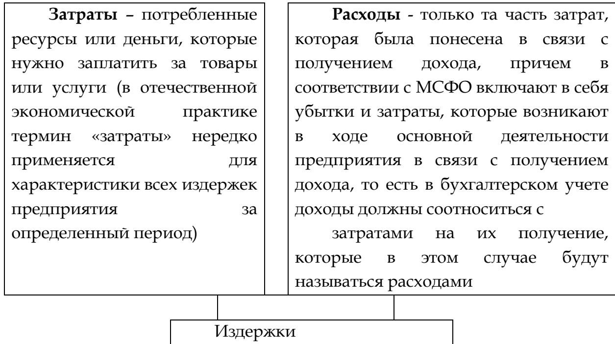
Рисунок 1. Состав издержек предприятия

Издержки - это затраты живого и овеществленного труда на производство и реализацию продукции, работ, услуг Схематически они изображены на рисунке