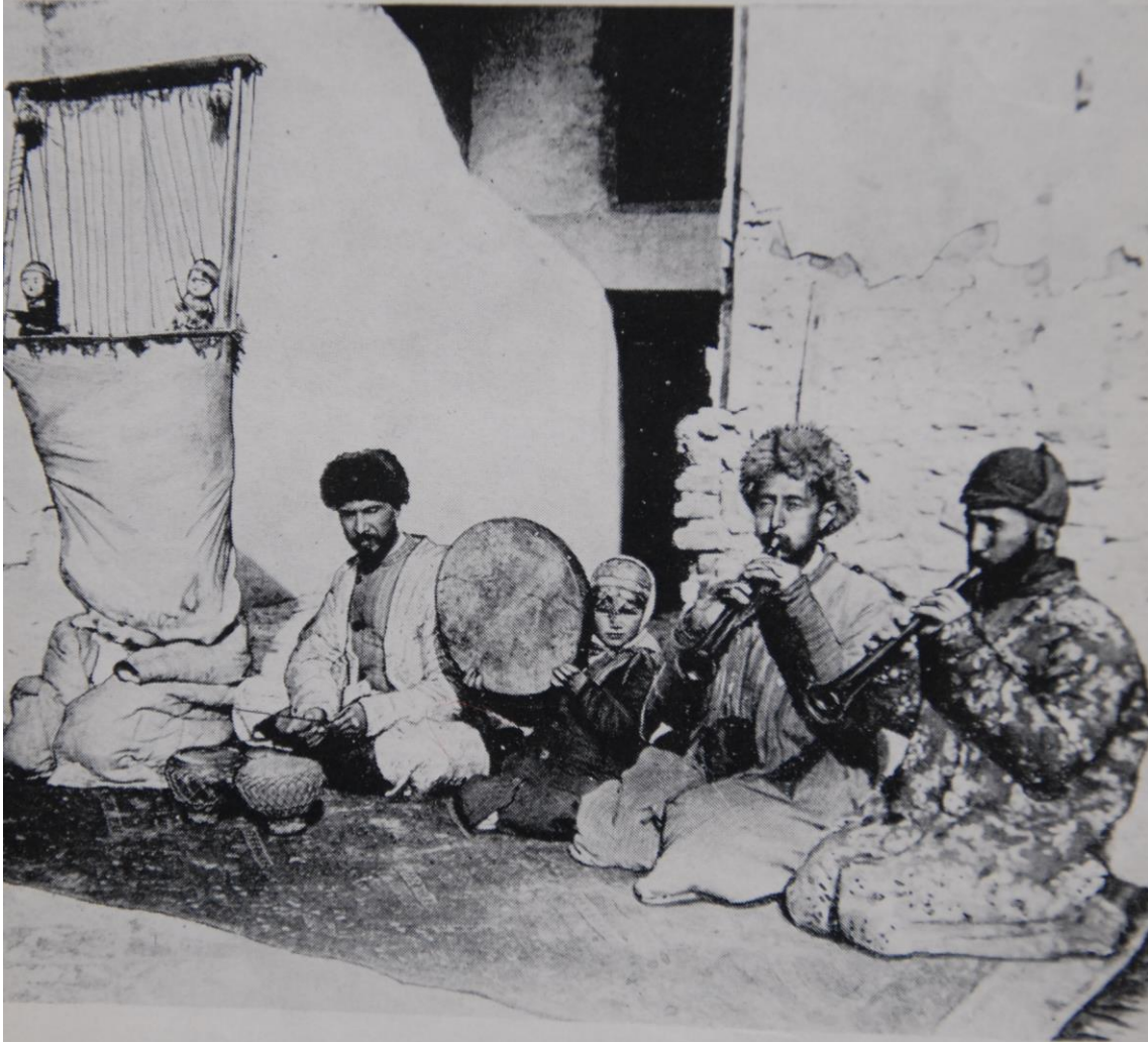
«Чодир жамол» театри труппаси. 1922 йил.