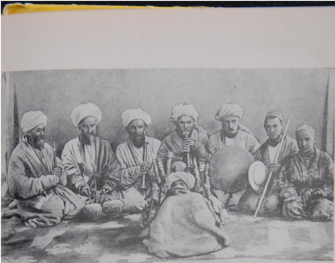
XX аср бошидаги қўғирчоқ театри труппаси.